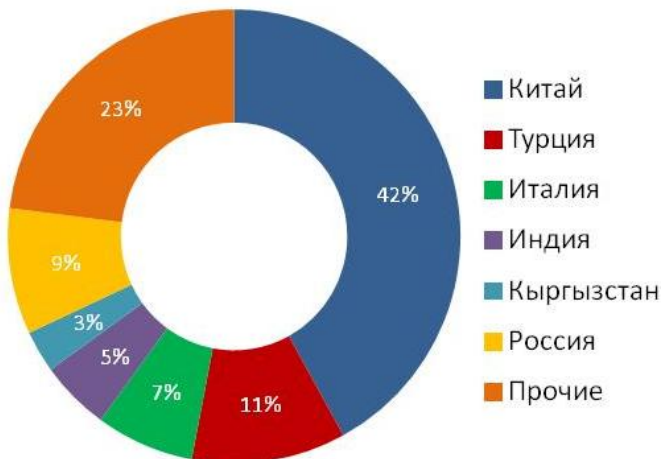
Импорт одежды в РК по странам (2011)

На рынке присутствуют крупные торговые сети, прежде всего, они сосредотачиваются на крупных городах (Алматы, Астана, Караганда, Шымкент)