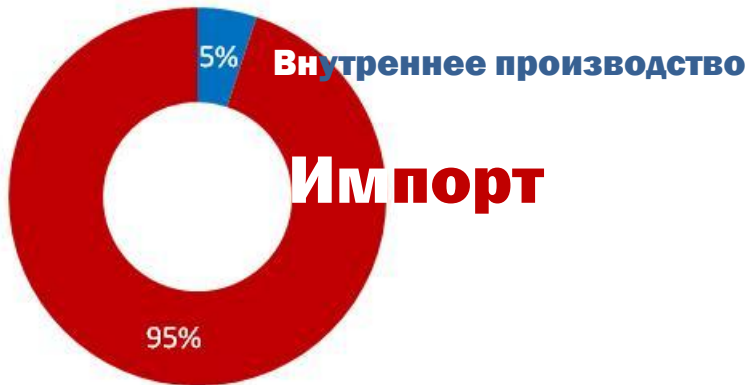
Рынок одежды в РК (2011)